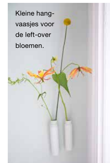
Kleine hangvaasjes voor de left-over bloemen.

‘AMBACHTELIJKE EENVOUD wordt weer gewaardeerd’