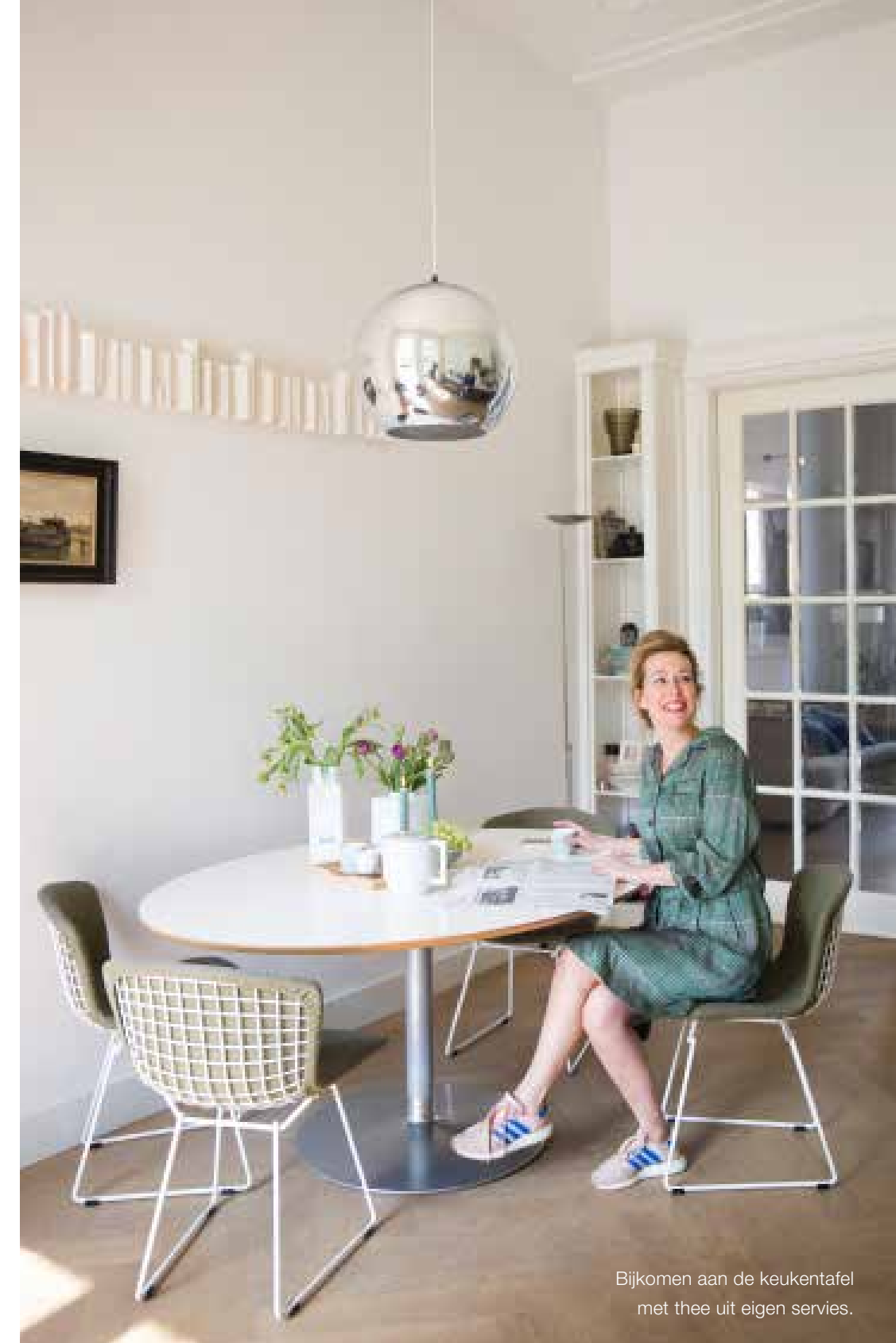
Bijkomen aan de keukentafel met thee uit eigen servies.