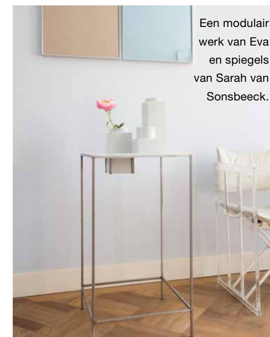
Een modulair werk van Eva en spiegels van Sarah van Sonsbeeck.