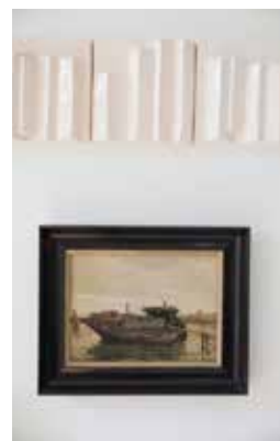
Een tegelreliëf van Eva gecombineerd met een 19de-eeuws schilderij.