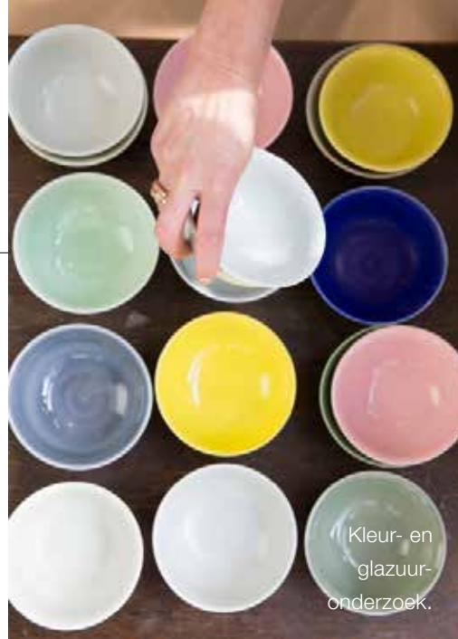
Kleur- en glazuuronderzoek.

is. Het huis, met voor- en achtertuin, heeft fraaie hoge plafonds, een heerlijke woonkeuken en een serre. Het pand dateert uit 1840. Van binnen oogt het Scandinavisch, met veel zachte, frisse kleuren, die ook in haar werk veel voorkomen. Het huis ademt rust. Opvallend veel kunst, schilderijen, foto's, objecten en veel van haar eigen ontwerpen. Zoals de vazen, zorgvuldig opgesteld, gevuld met losse bloemen. Blikvanger is de door haarzelf ontworpen bijzettafel,