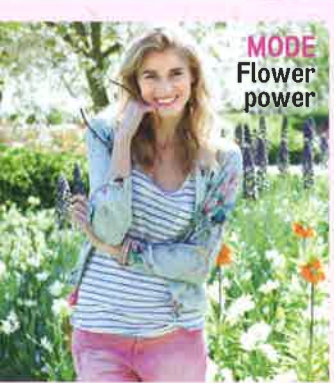
MODE Flower power