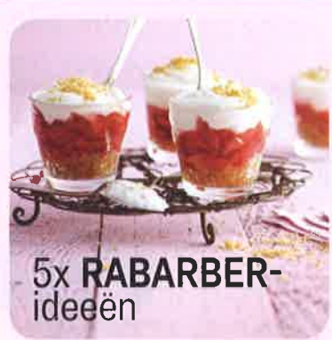
5x RABARBER- ideeën